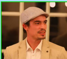
Grüne, Listenplatz 2