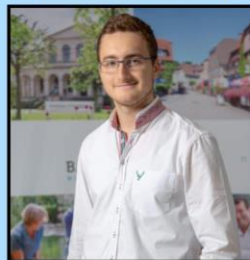
CSU, Listenplatz 19