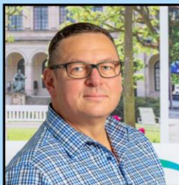
CSU, Listenplatz 12