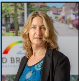
CSU, Listenplatz 1