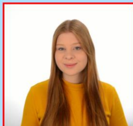
SPD, Listenplatz 4

Wir zählen auf eure Stimme. Vielen Dank.